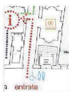
Ingresso futuro > soluzione proposta

cellente in cui la cultura non debba essere un monolite statico, ma piuttosto un organismo vivente capace di evolversi e adattarsi al mutare dei tempi, senza rinunciare al suo insostituibile bagaglio storico. Con l'avvio dei lavori, la città di Sienna si presenta dunque sullo scenario culturale con una promessa: quella di offrire un'istituzione che sia contemporaneamente custode della conoscenza e ponte verso il futuro dell'informazione digitale. Il Comune, con il sostegno di enti locali e privati come il Lions Club Sienna , testimonia così il proprio impegno nel garantire che la Biblioteca degli Intronati sia una porta sempre aperta sulla Sapienza, in un dialogo costante tra passato, presente e futuro. La cultura a Sienna , grazie a questa iniziativa, sta vivendo un'eccezionale trasformazione, in cui l'accesso al sapere non conosce più limiti di spazio e tempo, proiettando la Biblioteca comunale degli Intronati verso nuovi orizzonti di conoscenza e condivisione.